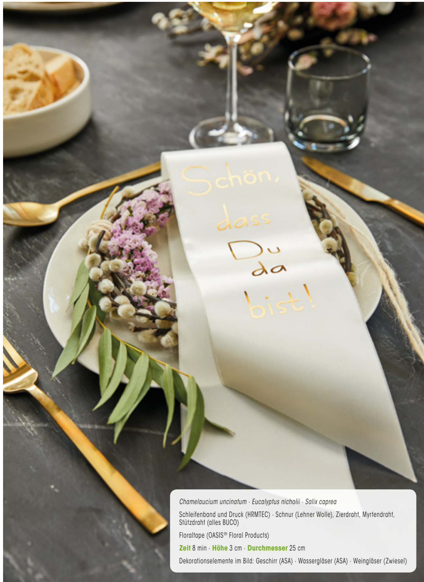
Chamelaucium uncinatum · Eucalyptus nicholii · Salix caprea Schleifenband und Druck (HRMTEC) · Schnur (Lehner Wolle), Zierdraht, Myrtendraht, Stützdraht (alles BUCO) Floraltape (OASIS® Floral Products) Zeit 8 min · Höhe 3 cm · Durchmesser 25 cm Dekorationselemente im Bild: Geschirr (ASA) · Wassergläser (ASA) · Weingläser (Zwiesel)