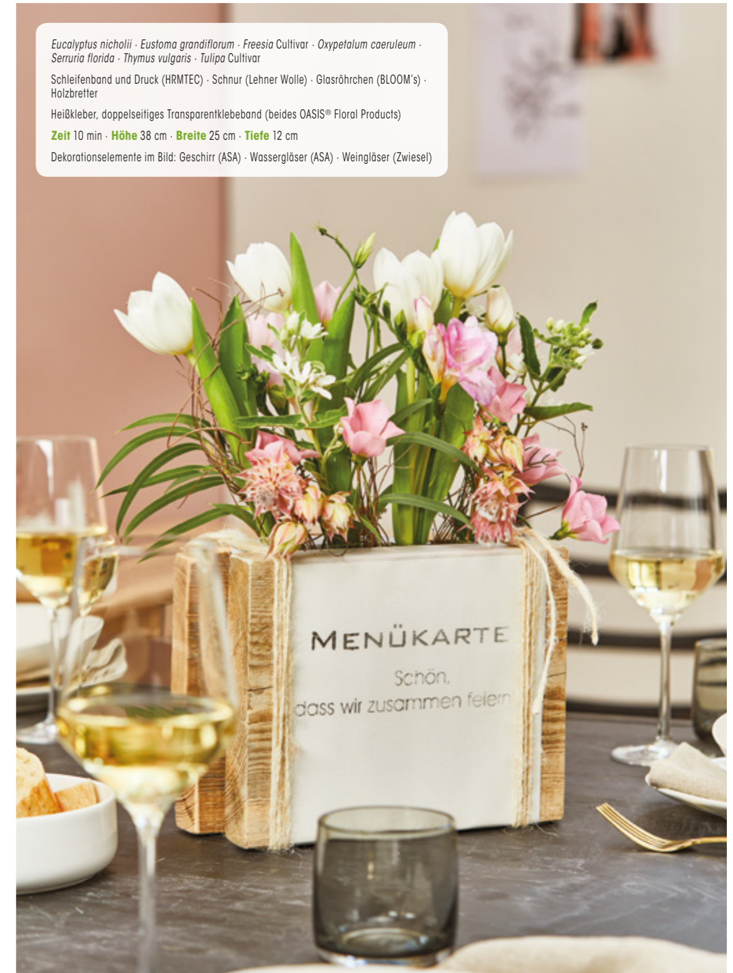
Eucalyptus nicholii · Eustoma grandiflorum · Freesia Cultivar · Oxypetalum caeruleum · Serruria florida · Thymus vulgaris · Tulipa Cultivar Schleifenband und Druck (HRMTEC) · Schnur (Lehner Wolle) · Glasröhrchen (BLOOM's) · Holzbretter Heißkleber, doppelseitiges Transparentklebeband (beides OASIS® Floral Products) Zeit 10 min · Höhe 38 cm · Breite 25 cm · Tiefe 12 cm Dekorationselemente im Bild: Geschirr (ASA) · Wassergläser (ASA) · Weingläser (Zwiesel)